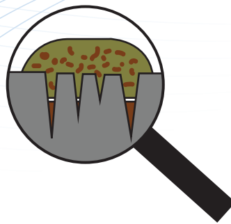
Bevochtiging met 'klassieke' reinigingsproducten